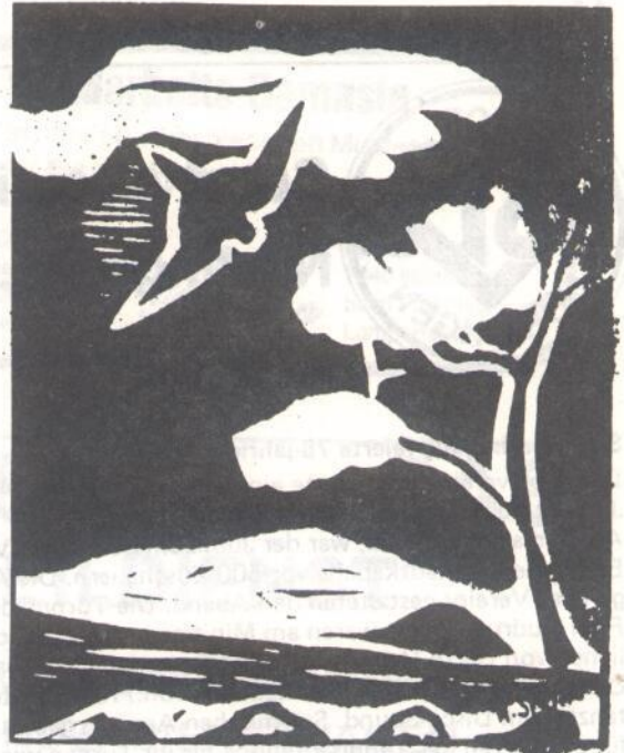
Wasserröhrlin Linolschnitt von H. Stein

Wir wünschen weiterhin viel Erfolg bei der Arbeit für die Stadt Nürtingen und nicht zuletzt für unseren Stadtteil.