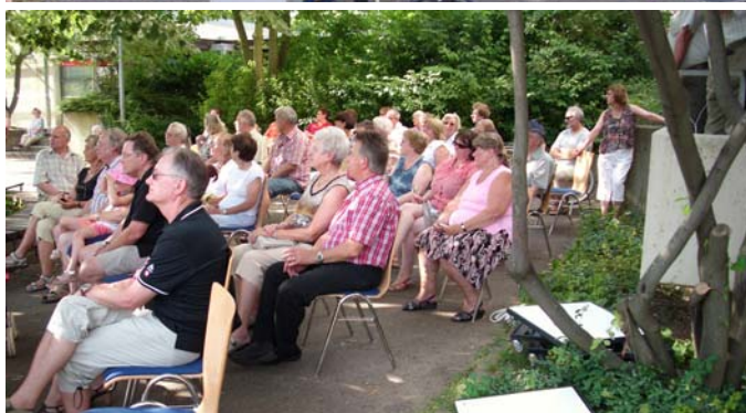
Unter den Bäumen im Schatten war der Musik gut zu lauschen.