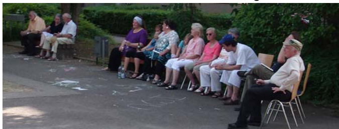
Alle möglichen Schattenplätze waren von den Zuhörern belegt.