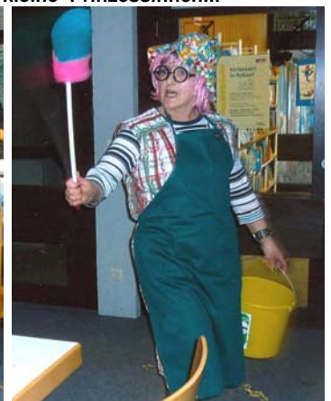
Also auf gehts, tschüss!