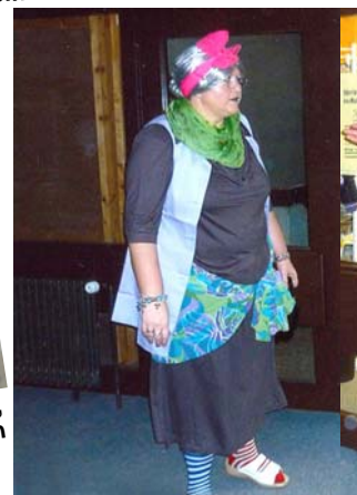
Ja, wo komscht du denn her