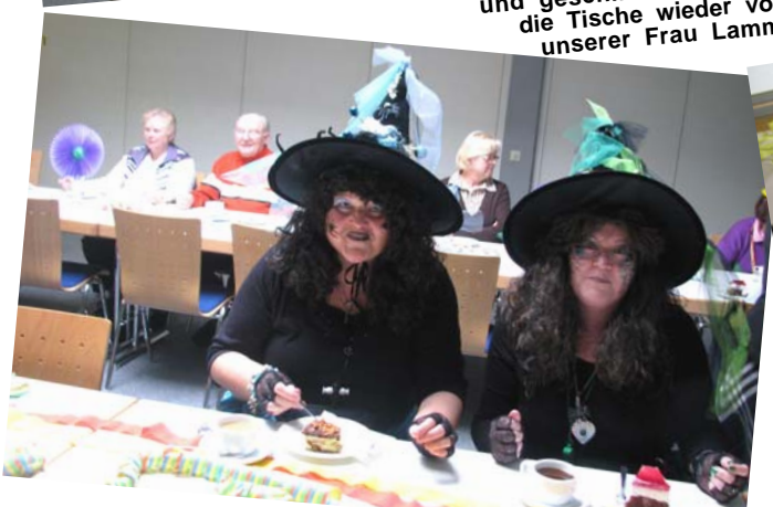
Diese beiden Strick- und Stechmücken tranken erst gemütlich Kaffee und aßen ein Stück Kuchen, bevor ihr Auftritt begann.