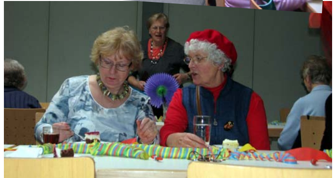
Ein Plausch zu zweit war auch möglich.