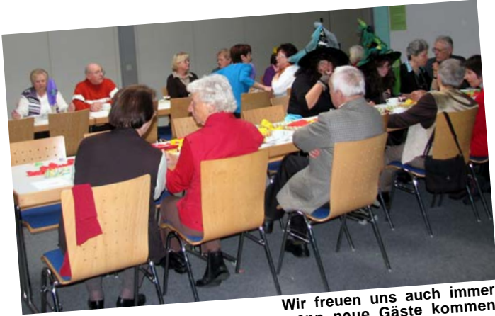
Wir freuen uns auch immer, wenn neue Gäste kommen.