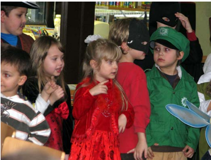
Sogar ein „Polizist“ war unter den Kindern und ganz in seinem Element.