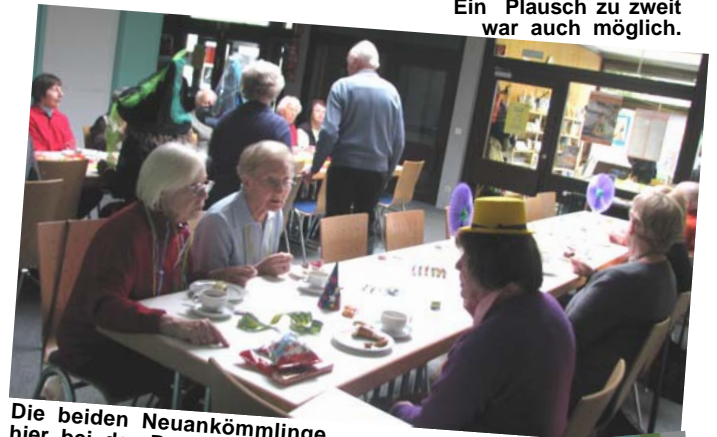
Die beiden Neuankömmlinge hier bei der Begrüßung.