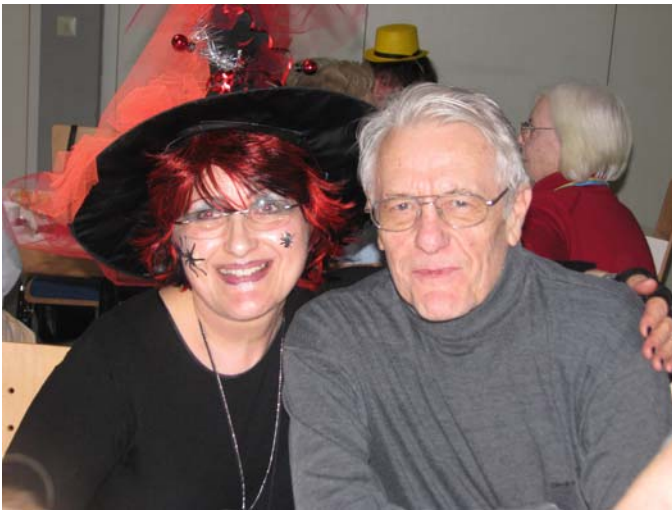
Diese Strick- und Stechmücke „umgarnte“ einen der Gäste.