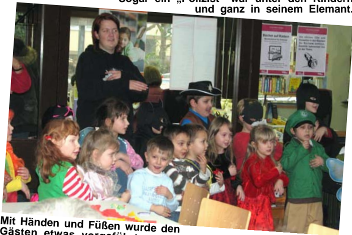
Mit Händen und Füßen wurde den Gästen etwas vorgeführt.