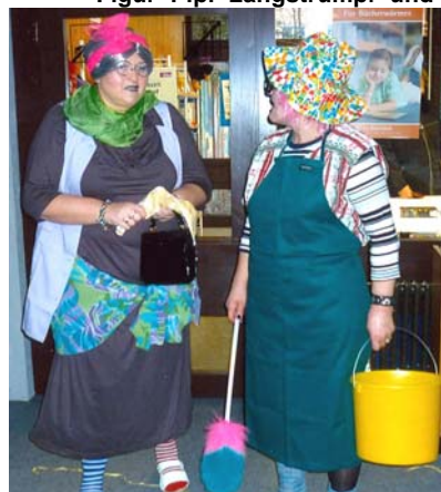
Jetzt müssa mer aber ans Putze.