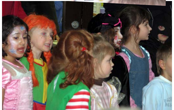
Ganz reizende Kostüme waren zu sehen, wie z.B. die bekannte Figur Pipi Langstrumpf und kleine Prinzessinnen...