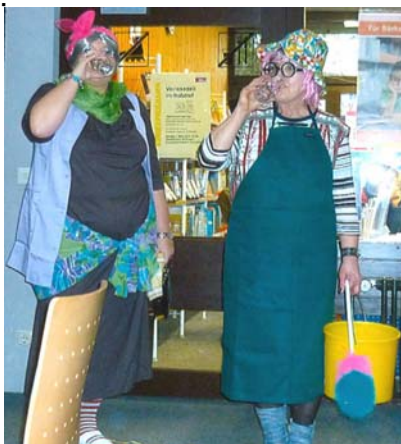
Da wolla mer zerst ebbes trinke.