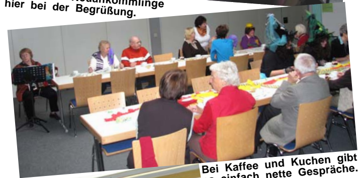
Bei Kaffee und Kuchen gibt es einfach nette Gespräche.