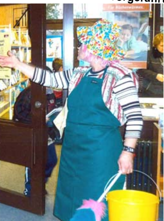
? I han di lang nemme gsee!