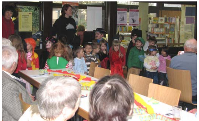
Auch die Betreuerinnen beteiligten sich fleißig. (Bild oben und darunter)