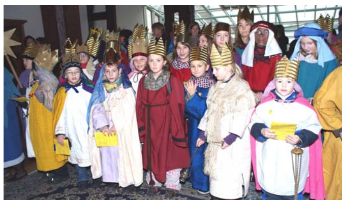
Die Sternsinger haben, wie man auf dem Bild erkennen kann, dem Rathaus ebenfalls einen Besuch abgestattet.

Diese Spalte Bilder zeigt Ihnen den Besuch der Sternsinger im Kursana-Altersheim (Haus Christopherus), wo die Kinder Freude bereiteten. An die Türe kommt der Segensgruß „Christus Mansionem Benedicat“.