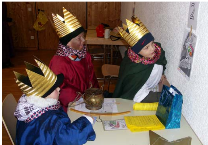
Die „Drei Könige“ schauen hier auf einem Plan an der Wand, in welches Gebiet des Roßdorfs sie zum Sammeln laufen müssen.