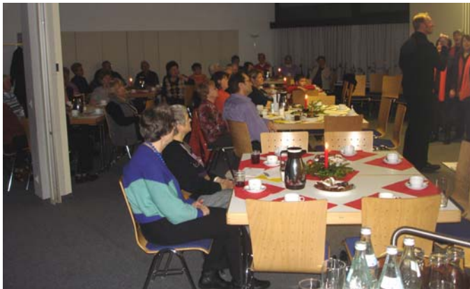
Die Zuhörer/innen lauschten den rhythmischen Melodien.