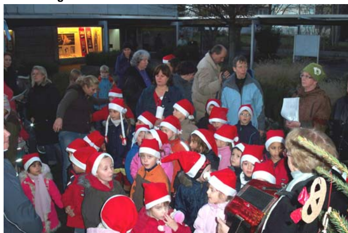
Aufstellung zum Singen der Lieder - die Kinder vom Dürerplatz.