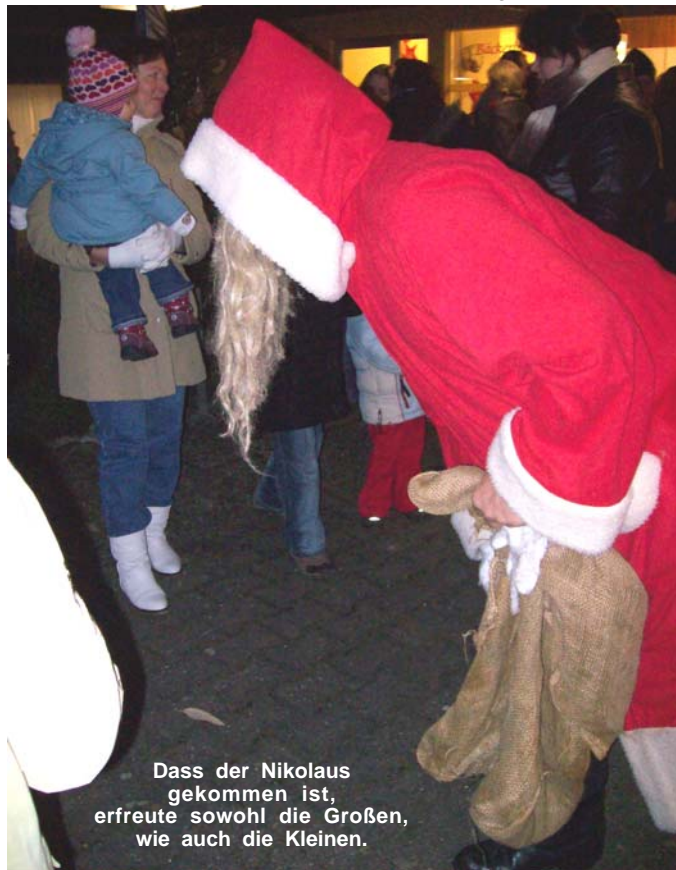
Dass der Nikolaus gekommen ist, erfreute sowohl die Großen, wie auch die Kleinen.