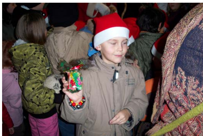
„Ich freue mich, denn das habe ich vom Nikolaus bekommen.“