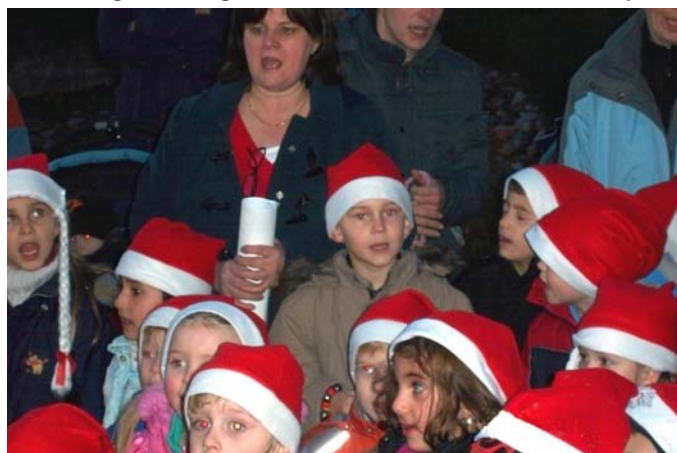
Hier unterstützten die Kindergärtnerinnen im Hintergrund den Auftritt und die Lieder der Kinder vom Dürerplatz.